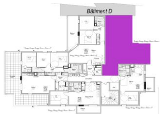
3eme étage - Bâtiment C