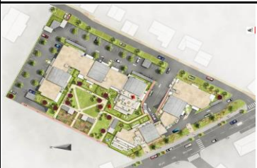
Plan de repérage